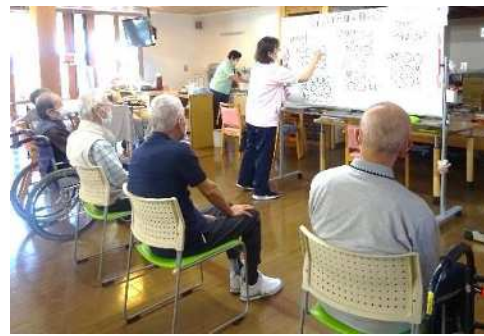
そろばんで脳トレ