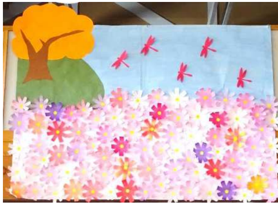
10月の壁画「秋桜の咲く風景」