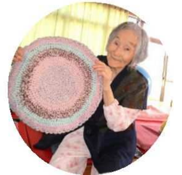
手編み座布団が完成しました♥♥