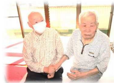
「元気じゃった？」久しぶりの再会に話はずんでいました。